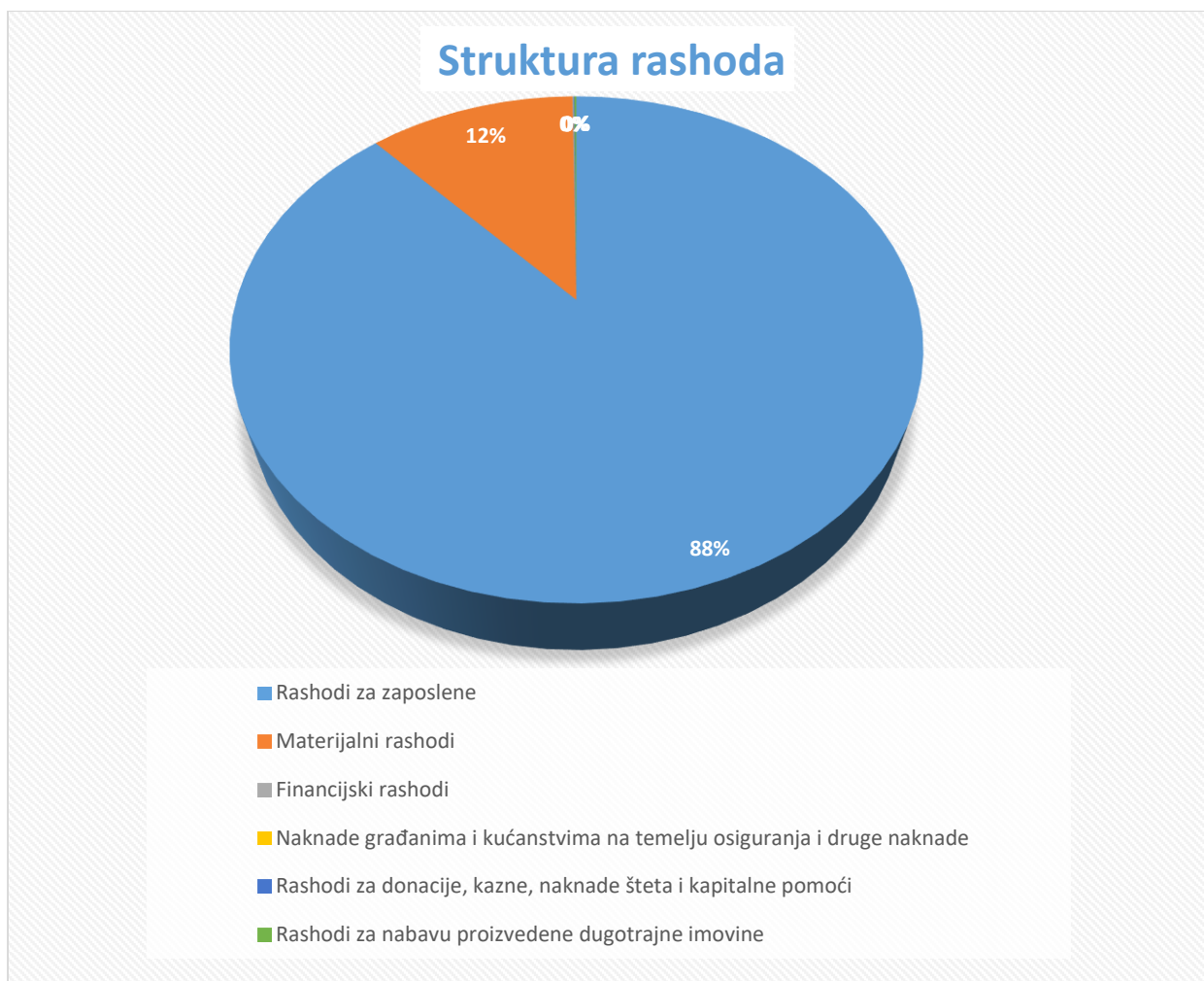
Grafikon 2: Struktura rashoda i izdataka

Najveći udio rashoda u ukupnim rashodima čine rashodi za zaposlene s čak 88%. Rashodi za zaposlene ostvareni su u postotku od 49,66%. Najveći dio odnosi se na rashode za zaposlene koji se isplaćuju kao pomoć Ministarstvo znanosti i obrazovanja. Isti su povećani za 22,97% u odnosu na prethodno polugodište zbog povećanog koeficijenta složenosti posla kao i osnovice za obračun plaće.